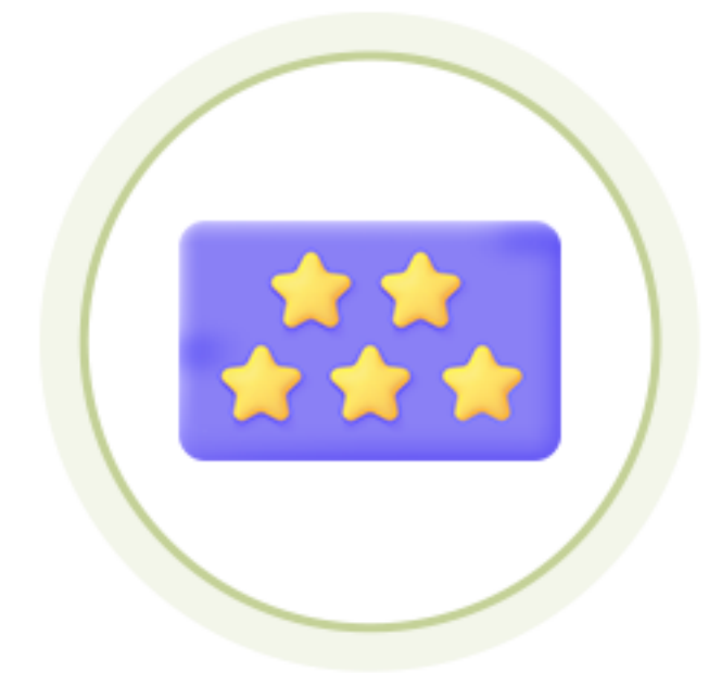
굿네이버스 채용 가산점