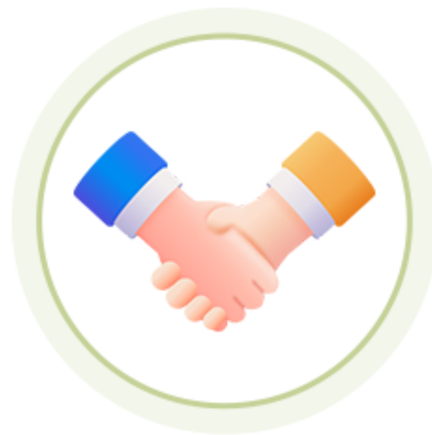
디자인씽킹 워크샵 참여 기회