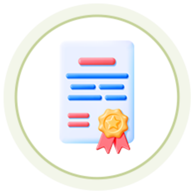
인성역량 강화과정 수료증