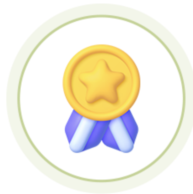
인성 인증 면접 뱃지